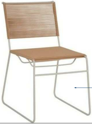
CADEIRA BOSSA CARAMELO- WESTWING DIMENSÕES(Lx A x C ) : 61X81 X 45 CM

- TODAS AS MEDIDAS DEVERÃO SER CONFERIDAS NO LOCAL - ESTE PROJETO ESTÁ SUJEITO A ADEQUAÇÕES DECORRENTES DE IMPREVISTOS NA OBRA