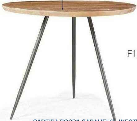
MESA DE JANTAR REDONDA BROOKLIN- MUMA DIMENSÕES(AxØ) : 75,8 X107CM