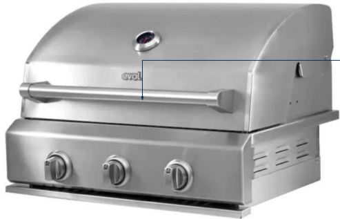
CHURRASQUEIRA A GÁS VERONA INOX DE EMBUTIR 69 CM CBK-300- EVOL DIMENSÕES (LxPxA) :69 X 59,7 X 47,3 CM.